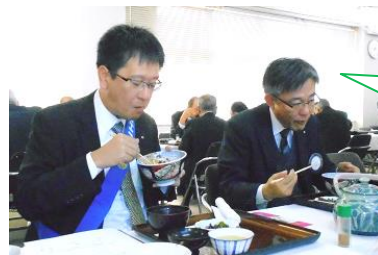
久しぶりの ウ・ナ・ギ