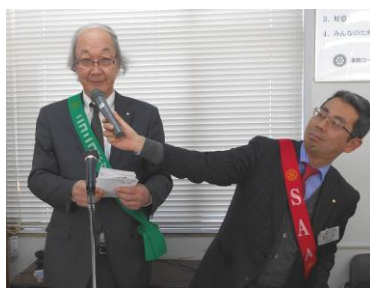
ニコボックス委員長も会場