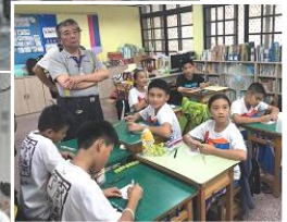
高義国民小学校の授業を視察