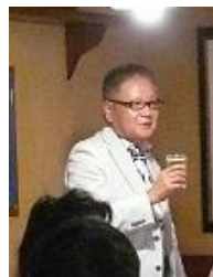
安江会長エレクト