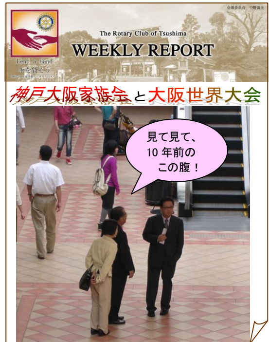
2004年6月4日発行第2514回会報増刊版より