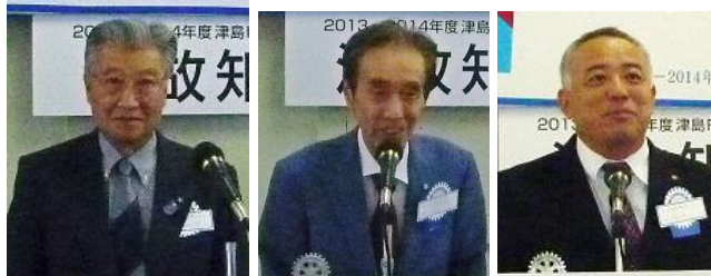
小島ガバナー補佐 三浦地区副幹事 長橋分区副幹事

1905年ポール・ハリスが、最初のロータリークラブを創立して以来、志を同じくするクラブが各地に生まれて、今では200以上の国と地域に広がっております。